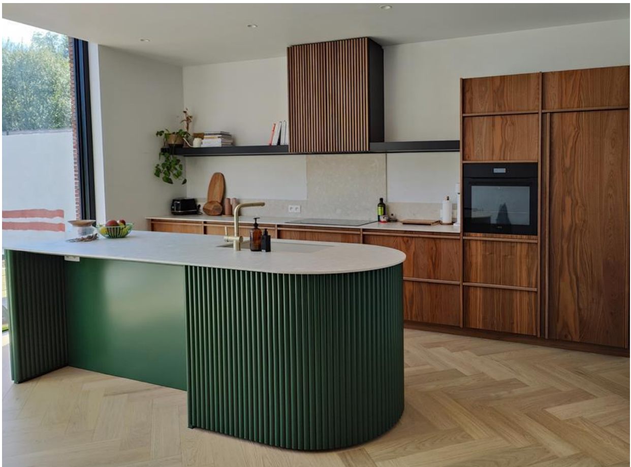
Met dit project won Trickx de Schrijnwerk Award 'Keuken'

"En dat is het alleen maar wanneer ik mijn creatieve ei kwijt kan en ik echt mijn ziel in een project kan leggen. Dat kan zowel om een eenvoudig kastje gaan als om een totaalproject. Dit jaar studeert bovendien mijn dochter af als interieurarchitect. Misschien komt ook zij in de zaak of bezorgt ze ons wat leuke projecten. We zien het allemaal wel. Niks moet maar veel mag."